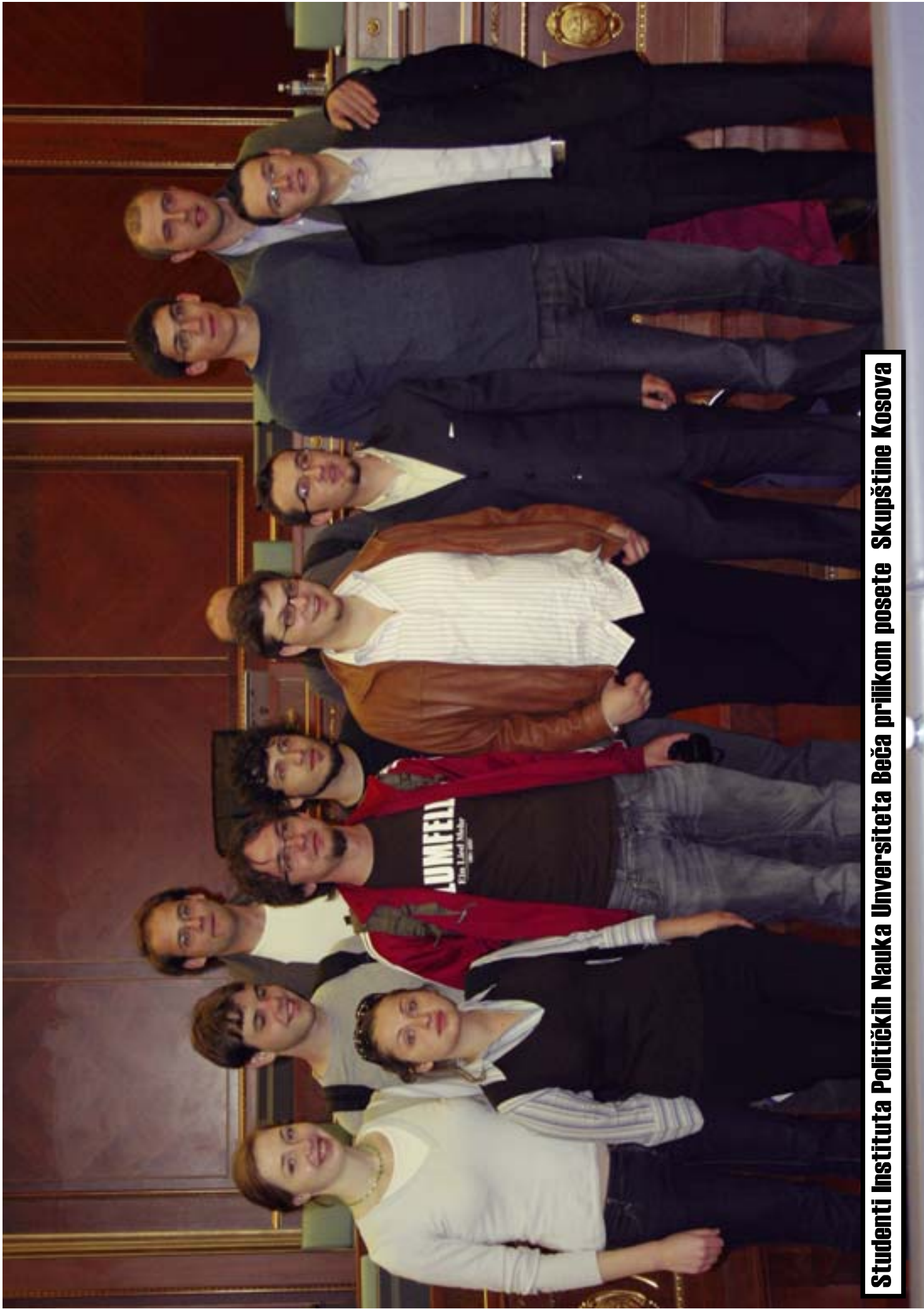
Studenti Instituta Političkih Nauka Univerziteta Beča prilikom posete Skupštine Kosova